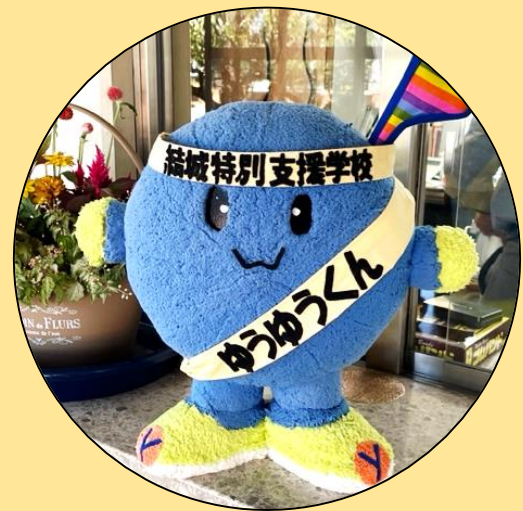
結城特別支援学校公認キャラクター 「ゆうゆうくん」