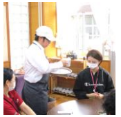
フードサービス 接客・販売業務