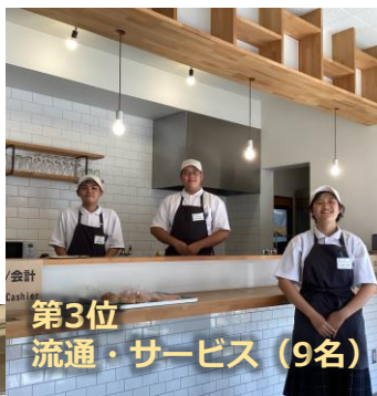
第3位 流通・サービス (9名)