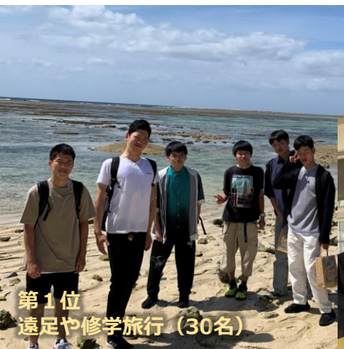
第1位 遠足や修学旅行 (30名)