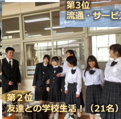
第2位 友達との学校生活！ (21名)