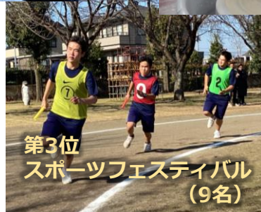
第3位 スポーツフェスティバル (9名)