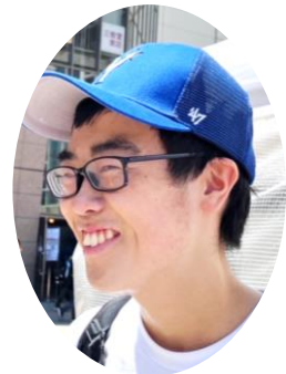
令和4年度卒業 勤務先: 株式会社LIXIL 石下工場

実は、中学校の時はあんまり楽しくなかったんです。でも、ビジネス・ライフ科の3年間は楽しかったです。授業も分かるようになったし、流通・サービスもよかった。先生も面白くて、毎日楽しかったです。