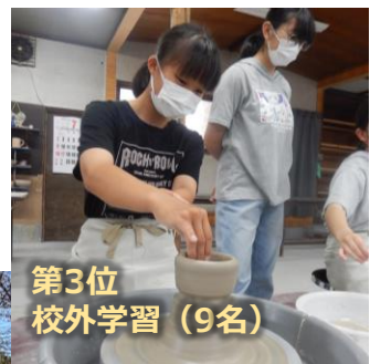
第3位 校外学習 (9名)