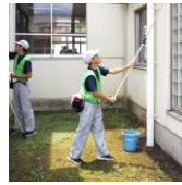
クリーンサービス 清掃業務