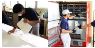
オフィスサービス 事務業務、商品管理

ビジネス・ライフ科だけにある授業です。どのサービスでも「働くために必要な力」を身に付けられるよう実践的な学習を行います。