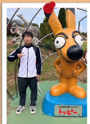
トッピーとパシャリ