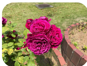
バラ とても良い香りがします