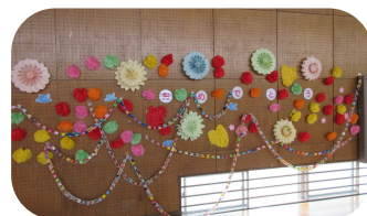
飾りつけも素敵でした